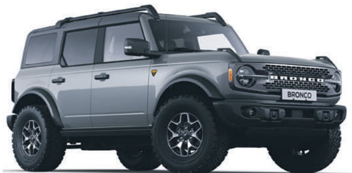
CARBONIZED GREY - LAKIER METALIZOWANY 5 700,-