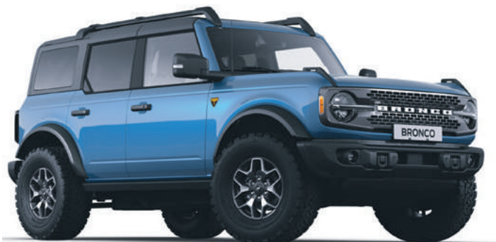
VELOCITY BLUE - LAKIER METALIZOWANY 6 700,-