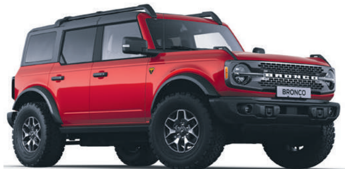
RACE RED - LAKIER ZWYKŁY 6 700,-