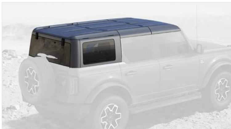
DACH HARDTOP W KOLORZE CARBONIZED GREY Standard