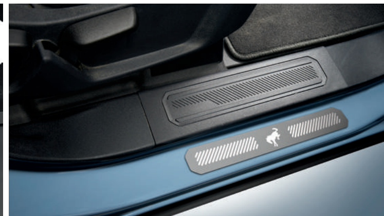
OZDOBNE NAKŁADKI OCHRONNE NA PROGI PRZÓD I TYŁ, Z LOGO BRONCO 935,-