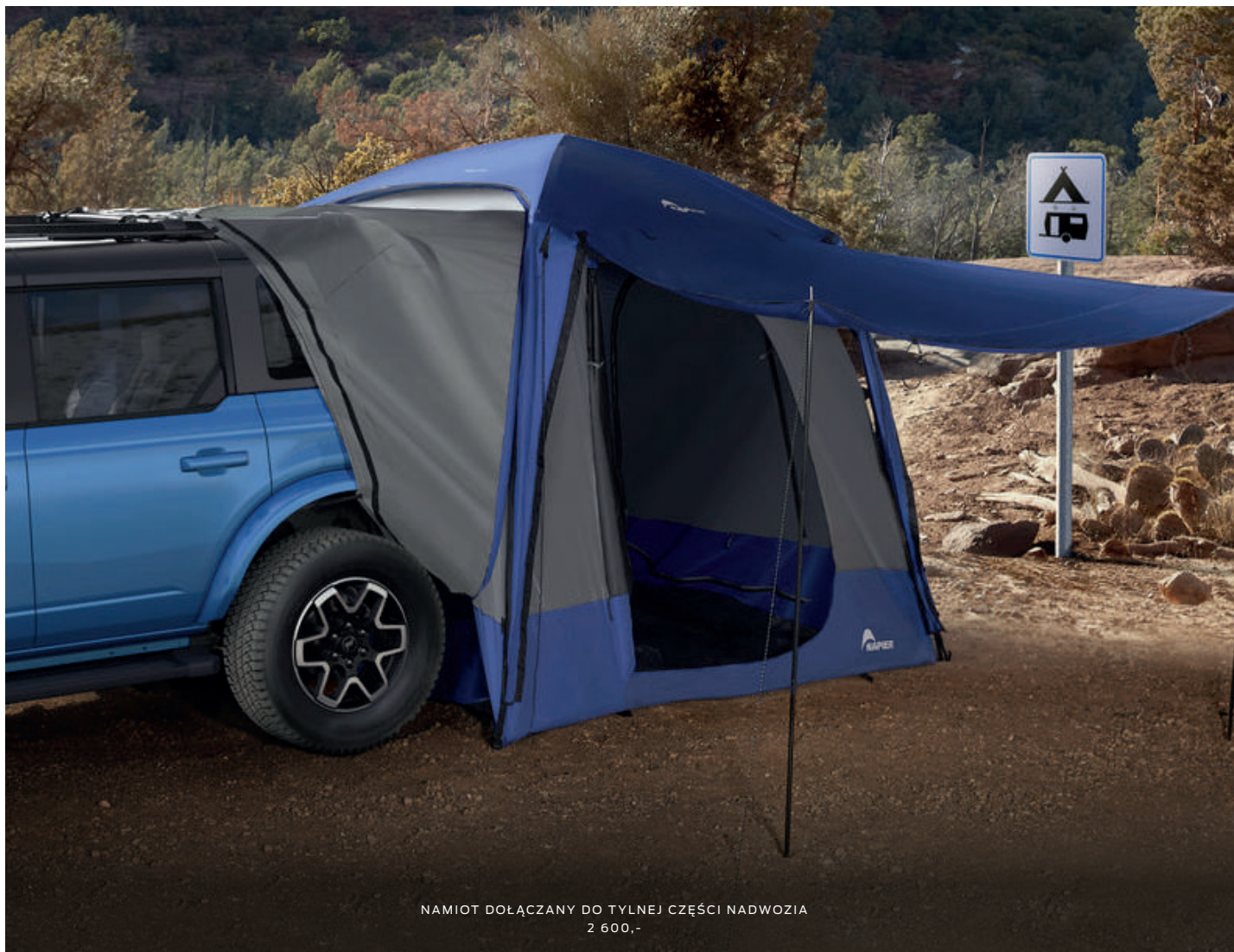
NAMIOT DOŁĄCZANY DO TYLNEJ CZĘŚCI NADWOZIA 2 600,-

(ilustracje mogą nieznacznie różnić się od wersji produkcyjnej)