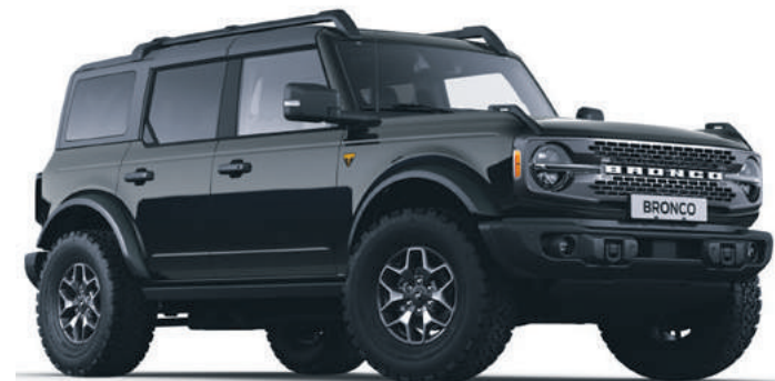
ABSOLUTE BLACK - LAKIER SPECJALNY 5 700,-