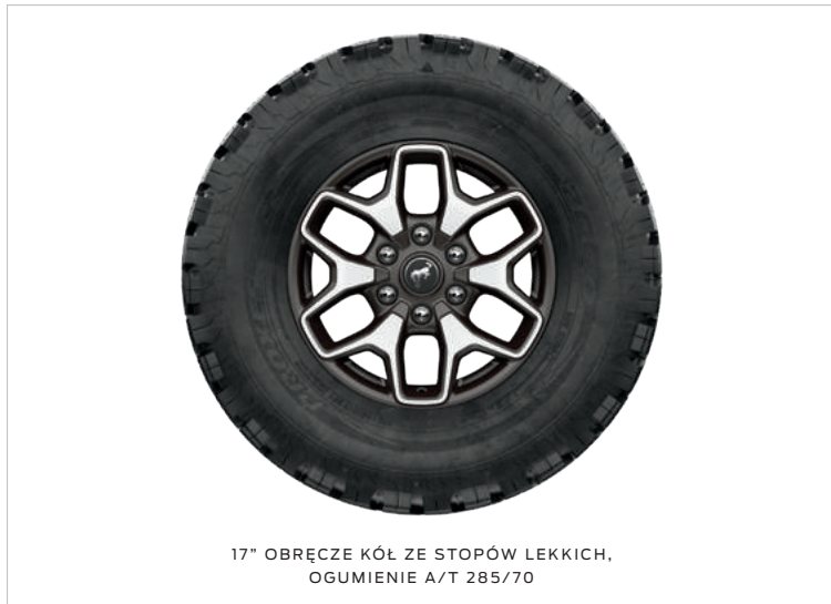
17" OBRĘCZE KÓŁ ZE STOPÓW LEKKICH, OGUMIENIE A/T 285/70