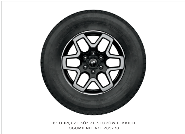
18" OBRĘCZE KÓŁ ZE STOPÓW LEKKICH, OGUMIENIE A/T 285/70