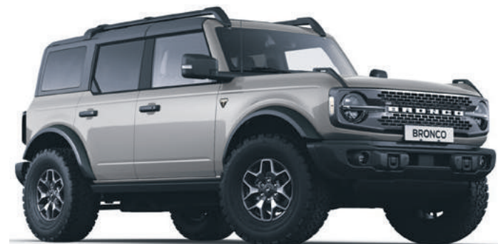
ICONIC SILVER - LAKIER METALIZOWANY SPECJALNY 6 700,-