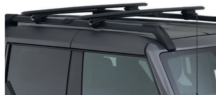
THULE® ,BELKI DACHOWE POPRZECZNE THULE 2 900,-