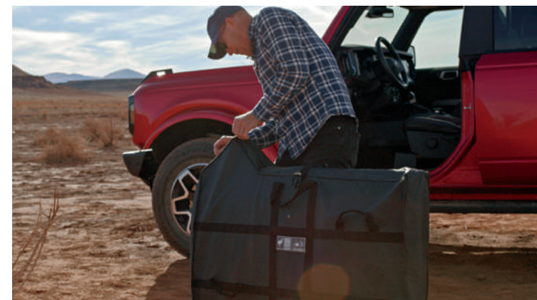
POKROWCE DO PRZECHOWYWANIA DRZWI DRZWI PRZEDNIE | 1 200,- DRZWI TYLNE | 1 200,-

(ilustracje mogą nieznacznie różnić się od wersji produkcyjnej)