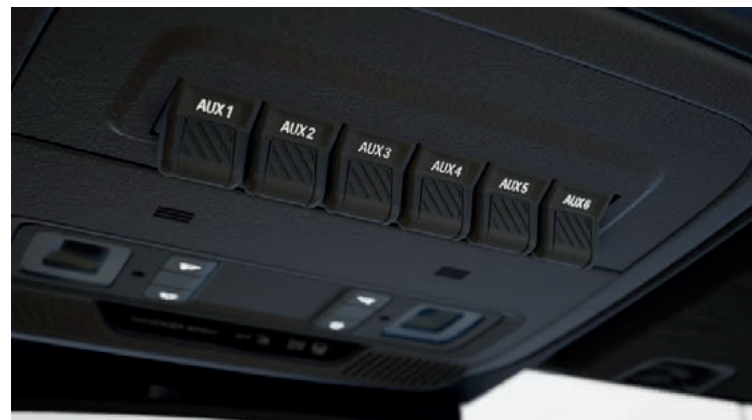
KONSOLA DACHOWA Z PRZEŁĄCZNIKAMI DO PODŁĄCZENIA DODATKOWYCH URZĄDZEŃ