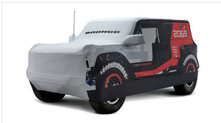
PEŁNY POKROWIEC COVERKING 4 500,-