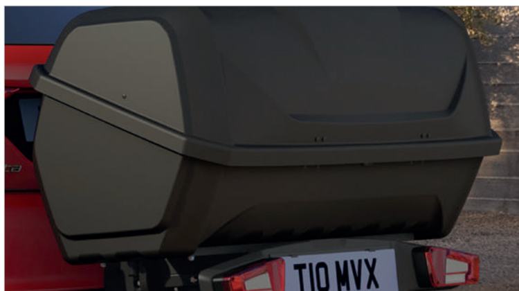
BAGAŻNIK DO MOCOWANIA NA HAKU HOLOWNICZYM (WYMAGA STELAŻA) 2 386,-