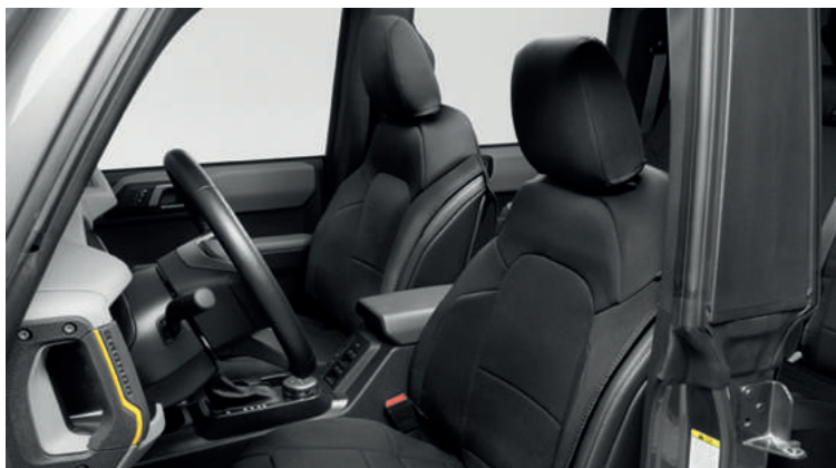
POKROWCE NA PRZEDNIE FOTELE COVERKING 1 450,-