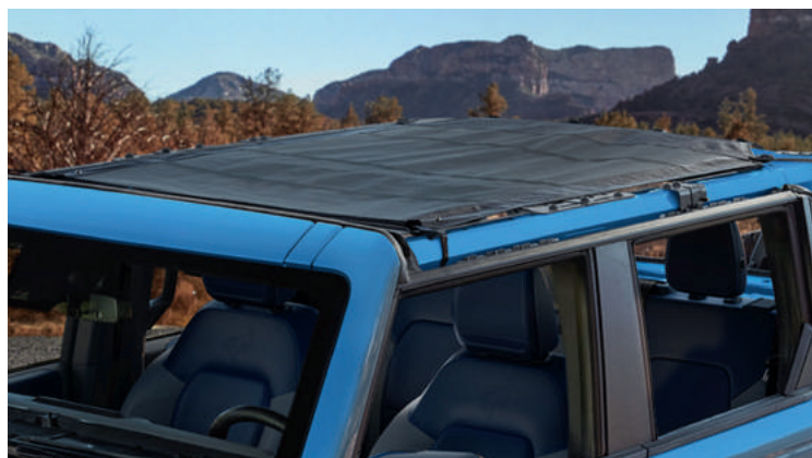
OŚLONA PRZECIWSŁONECZNA BIMINI - UMOŻLIWIA JAZDĘ Z OTWARTYM DACHEM, CHRONIĄC PRZED OSTRYM SŁOŃCEM 2 150,-