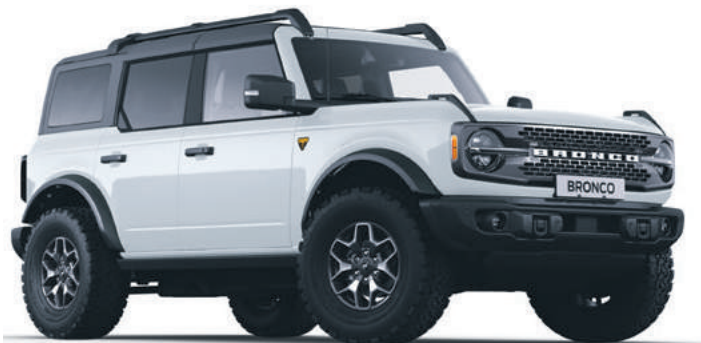
OXFORD WHITE - LAKIER ZWYKŁY bez dopłaty