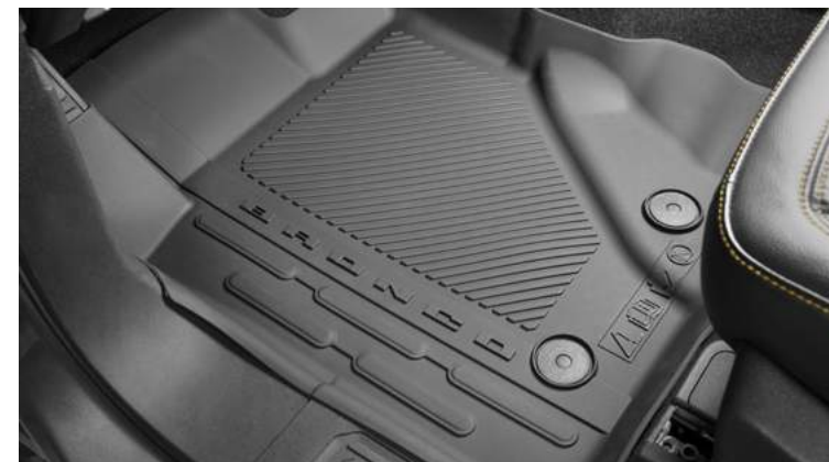
DYWANKI PODŁOGOWE - GUMOWE (PRZÓD I TYŁ) 990,-

(ilustracje mogą nieznacznie różnić się od wersji produkcyjnej)