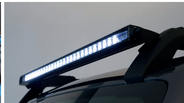
LISTWA OŚWIETLENIOWA LED MOCOWANA DO BAGAŻNIKA DACHOWEGO (WYŁĄCZNIE DO UŻYTKU POZA DROGAMI PUBLICZNYMI) 6 519,-