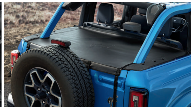
OŚLONA PRZEDZIAŁU BAGAŻOWEGO COVERKING 750,-