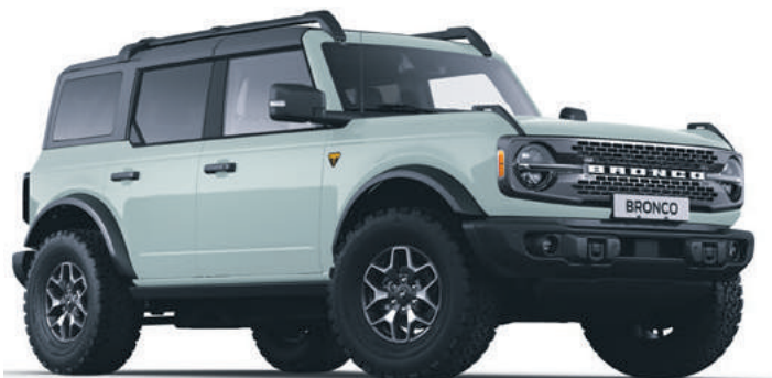
CACTUS GREY - LAKIER SPECJALNY 6 700,-