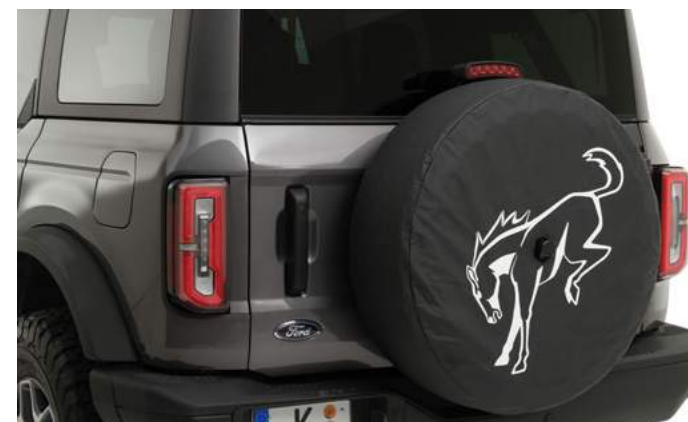
POKROWIEC NA KOŁO ZAPASOWE 750,-