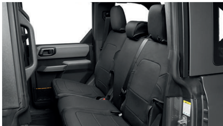
POKROWCE NA TYLNE FOTELE COVERKING 1 450,-