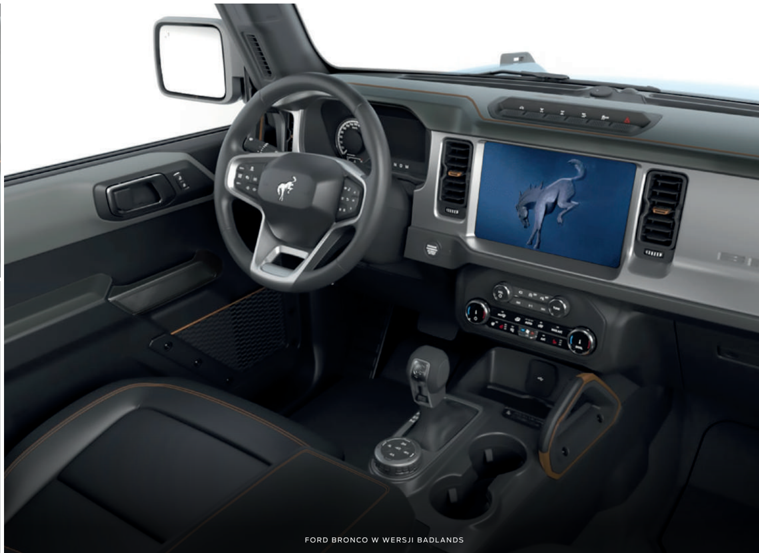
FORD BRONCO W WERSJI BADLANDS

(ilustracje mogą nieznacznie różnić się od wersji produkcyjnej)