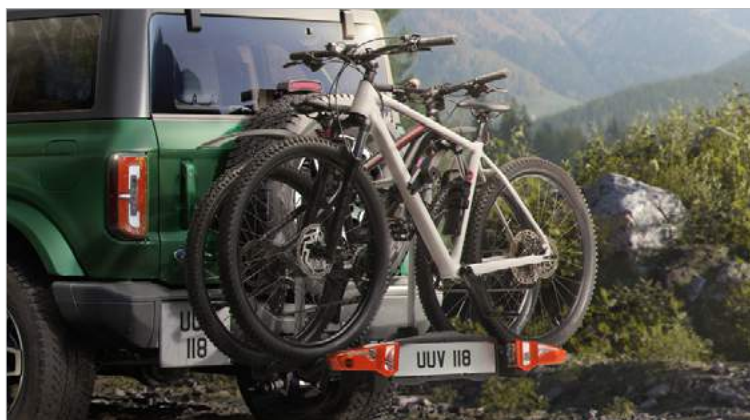
BAGAŻNIK ROWEROWY MOCOWANY NA HAKU 2 681,-