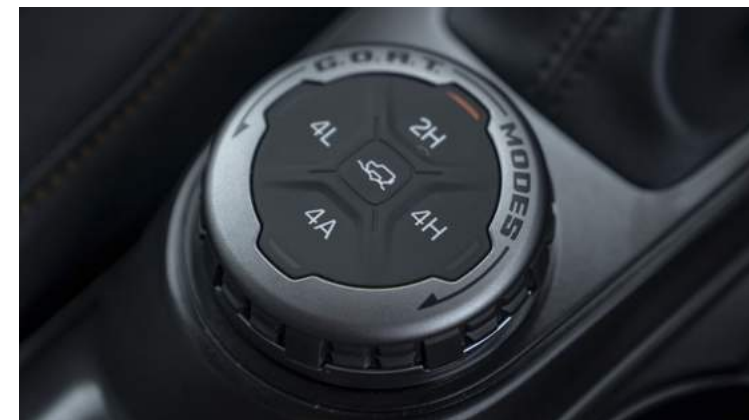
TERRAIN MANAGEMENT SYSTEM™ - SYSTEM WYBORU TRYBU JAZDY Standard