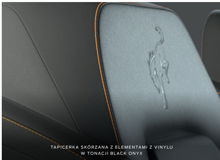
TAPICERKA SKÓRZANA Z ELEMENTAMI Z VINYLU W TONACJI BLACK ONYX