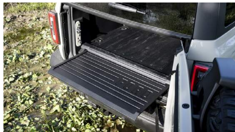
WYSUWANY STOPIEŃ POD PODŁOGĄ DRZWI BAGAŻNIKA