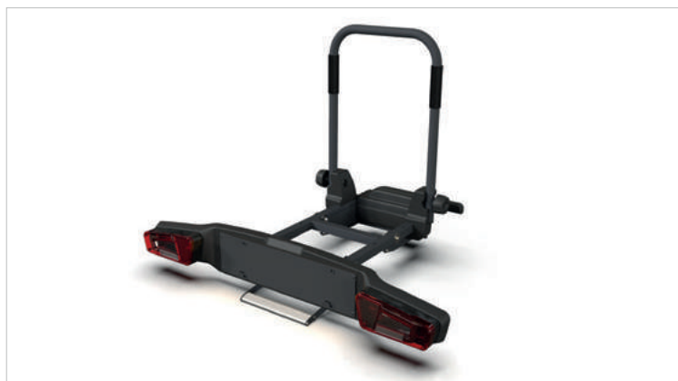
STELAŻ DO BAGAŻNIKA - MOCOWANEGO NA HAKU HOLOWNICZYM 2 202,-