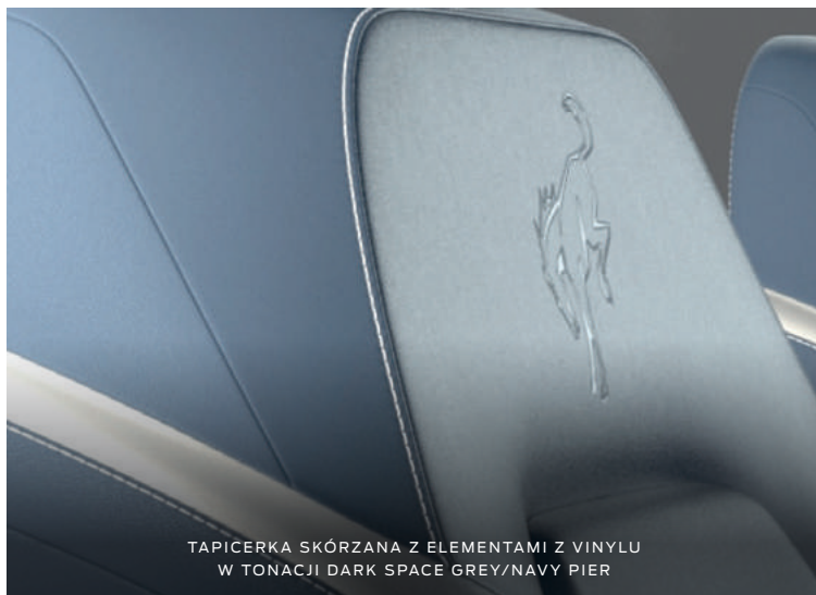
TAPICERKA SKÓRZANA Z ELEMENTAMI Z VINYLU W TONACJI DARK SPACE GREY/NAVY PIER