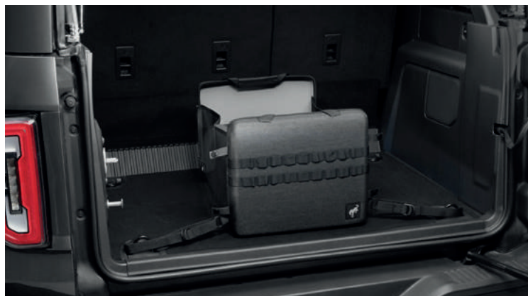
ORGANIZER PRZESTRZENI BAGAŻOWEJ 490,-