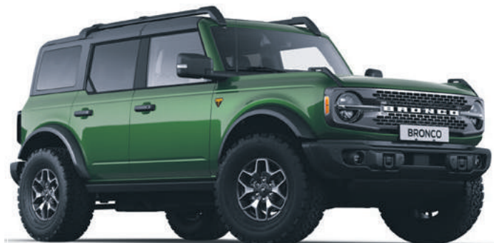
ERUPTION GREEN - LAKIER METALIZOWANY 5 700,-