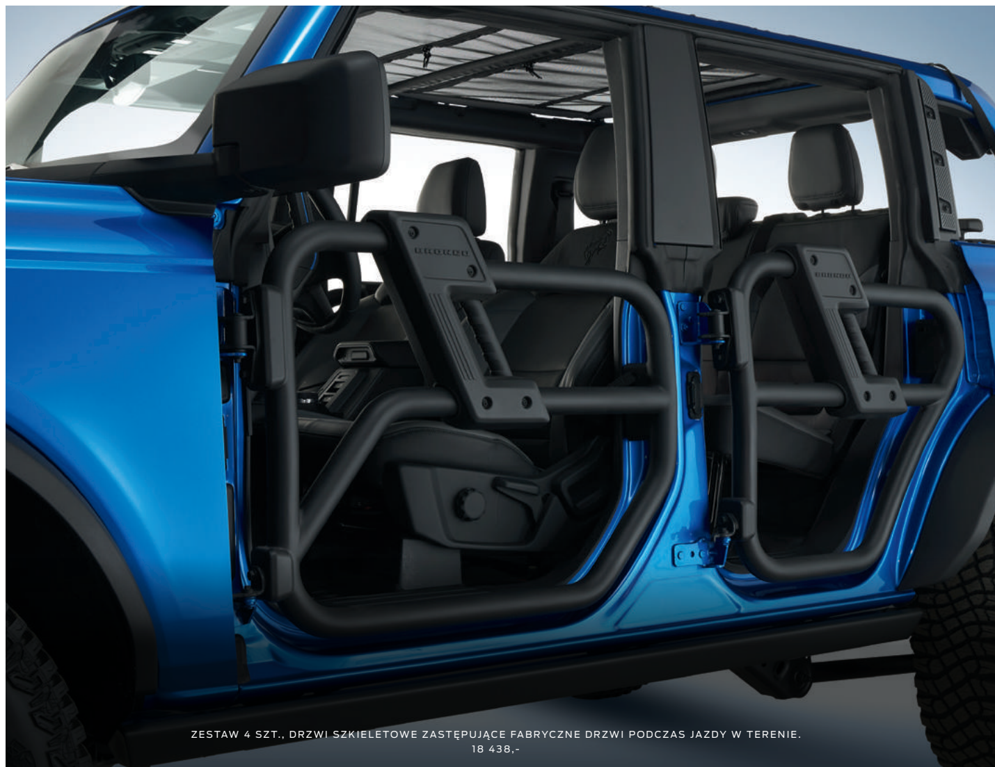
ZESTAW 4 SZT., DRZWI SZKIELETOWE ZASTĘPUJĄCE FABRYCZNE DRZWI PODCZAS JAZDY W TERENIE. 18 438,-

(ilustracje mogą nieznacznie różnić się od wersji produkcyjnej)