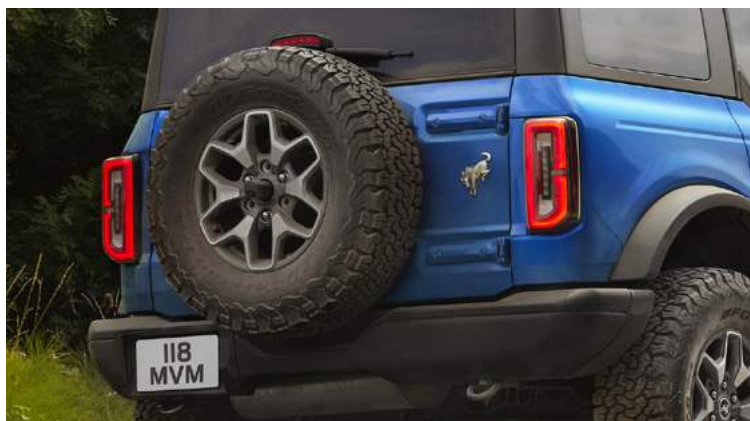
KOŁO ZAPASOWE NA TYLNEJ KLAPIE Standard